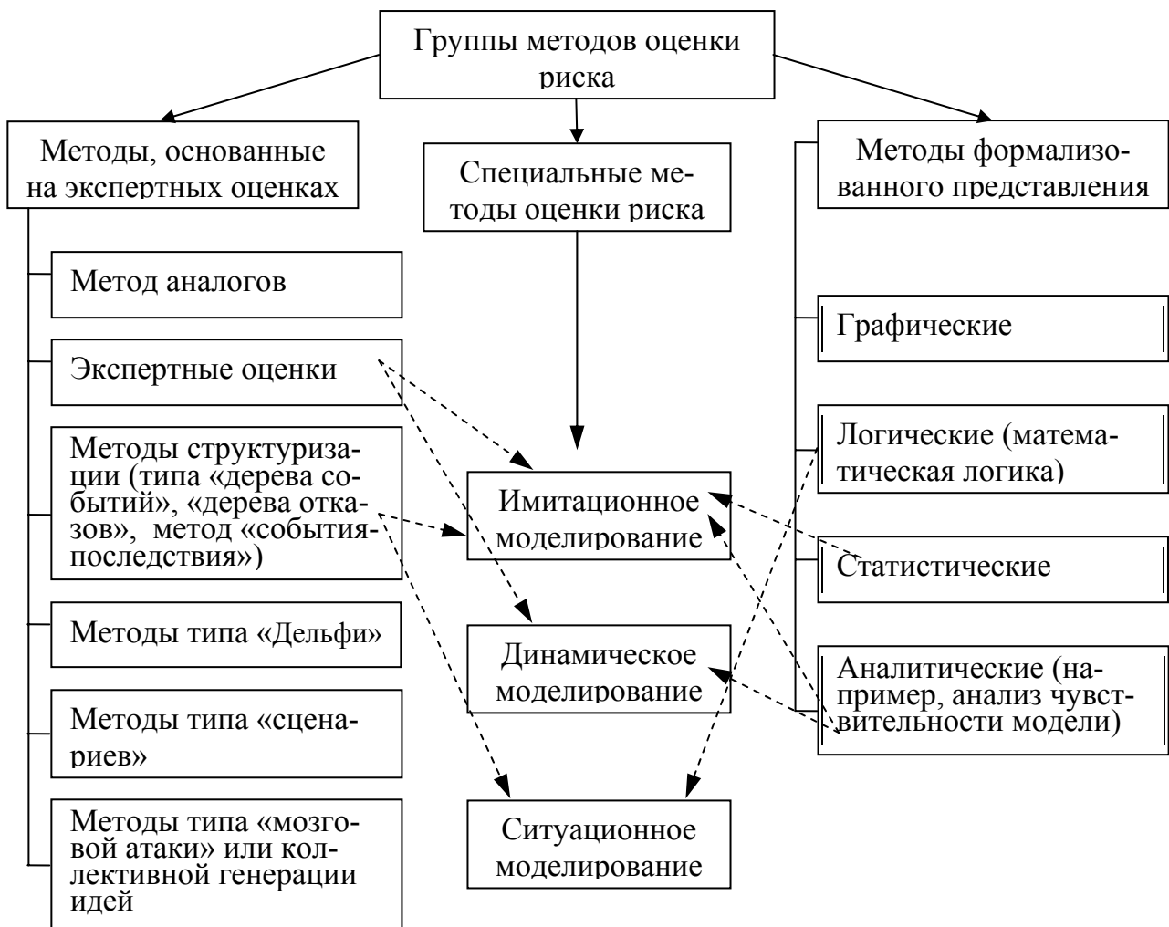
Рис. 5. Классификация методов оценки риска

оценка рисков с помощью групп методов формализованного и неформализованного (основанных на экспертных оценках) представления затрудняет обеспечение и реализацию основных принципов контроллинга рисков. Поэтому в основу исследования были положены принципы динамического моделирования. Именно в рамках динамического моделирования в работе была разработана нормативная модель оценки рисков (стандарт) на основе ординальной шкалы измерения, которая представляет собой такой порядок движения его показателей–индикаторов, соблюдение которого на длительном интервале времени в реальной деятельности предприятия обеспечивает минимизацию риска.