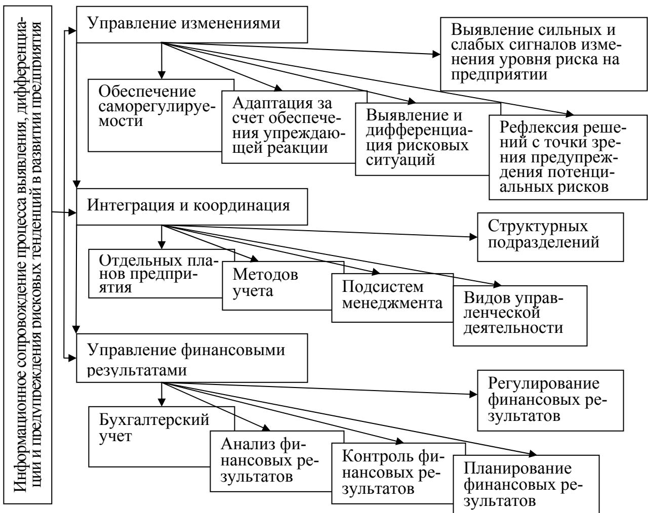
Рис. 2. Иерархия уровней функций и подфункций контроллинга

На основе анализа и синтеза концептуальных характеристик и свойств экономических категорий «контроллинг» и «риск» сущность понятия «контроллинг рисков» определяется как система информационного обеспечения процесса принятия менеджментом стратегических и оперативных управленческих решений по предотвращению влияния рисков на деятельность предприятия для обеспечения и реализации основных целей его развития. Исходя из определения сущности контроллинга рисков, основной функцией данной системы будет являться информационное сопровождение процесса выявления, дифференциации и предупреждения рисков тенденций в развитии предприятия, декомпозиция которой на дерево функций и подфункций контроллинга рисков представлена на рисунке 2.