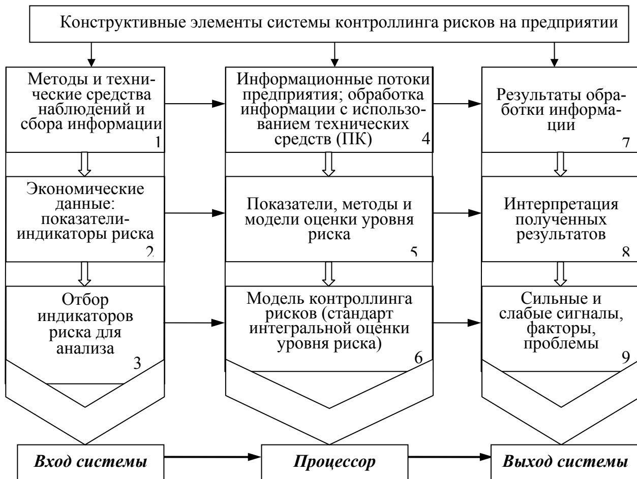
Рис. 4. Концептуальная модель системы контроллинга рисков на предприятии вертикальных и горизонтальных информационных потоков. При этом вертикальные информационные потоки характеризуют постоянный процесс генезиса элементов входа, процессора и выхода системы, а горизонтальные информационные потоки характеризуют, соответственно, синтаксический, семантический и прагматический уровни преобразования и представления информации.

В исследовании показано, что такое представление системы контроллинга рисков способно обеспечить управление с упреждением, адаптацию деятельности предприятия к изменяющимся внутренним и внешним условиям.