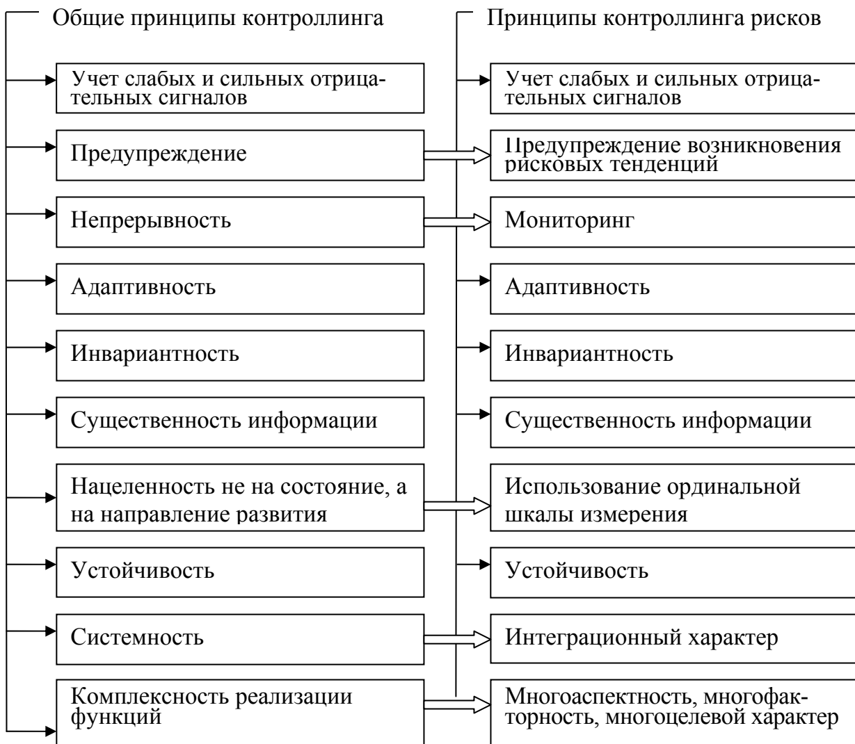
Рис. 3. Принципы контроллинга рисков

С позиций настоящего исследования с целью разработки соответствующего методического подхода к организации системы контроллинга рисков на предприятии были сформулированы принципы формирования и реализации данной системы на основе декомпозиции и спецификации сформулированных ранее общих принципов контроллинга, которые представлены на рисунке 3.