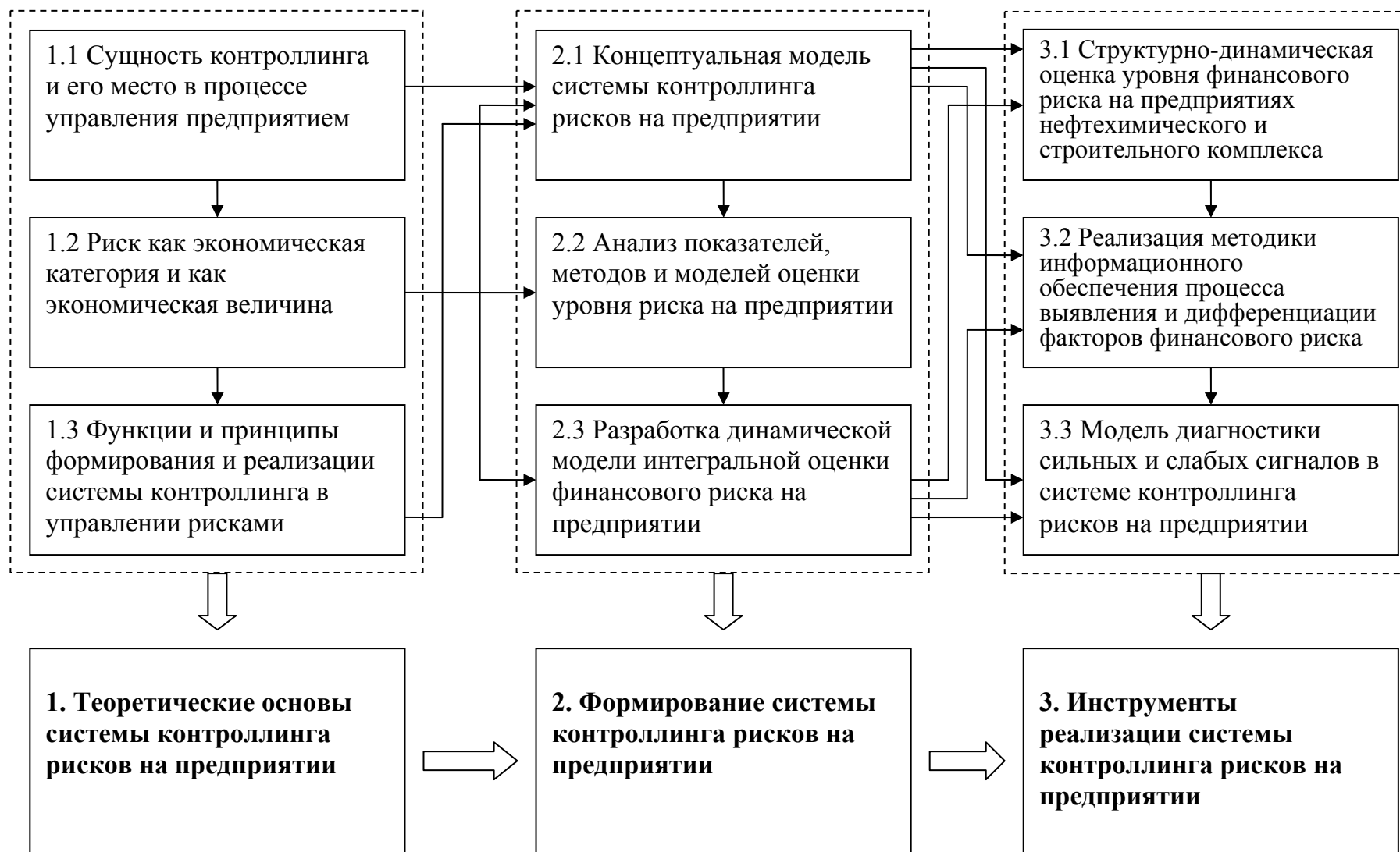
Рисунок 1. Концепция диссертационного исследования