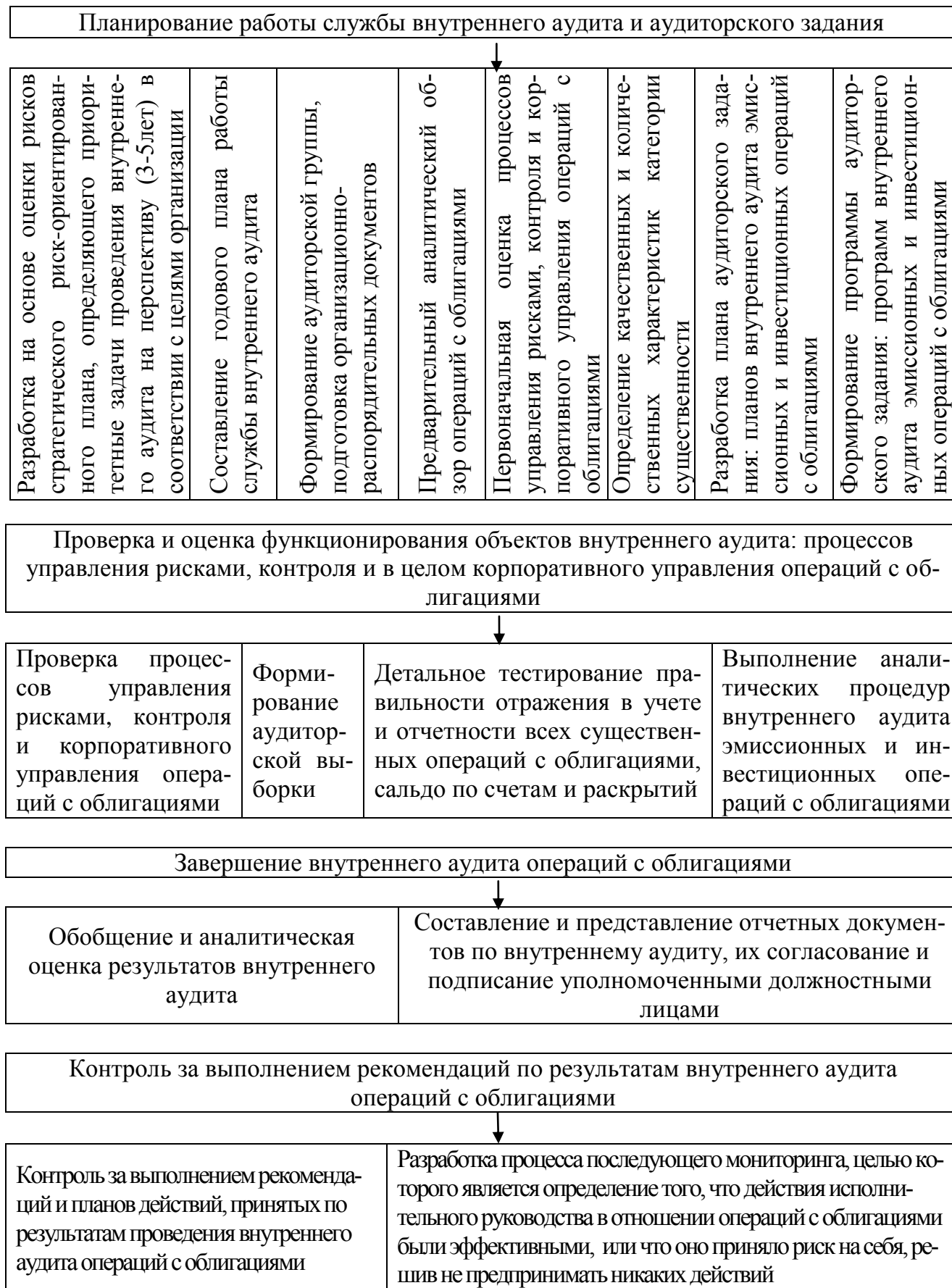
Рис. 2. Рекомендуемые основные этапы технологии внутреннего аудита операций с облигациями