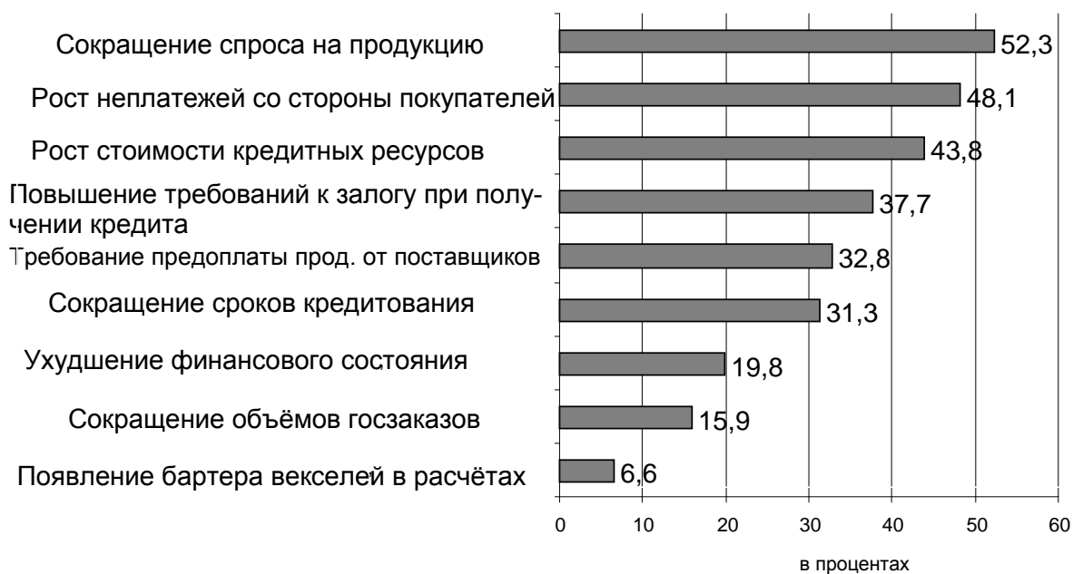
Рис. 3. Основные проблемы, с которыми сталкиваются предприятия вследствие кризиса (доля респондентов, назвавших данную проблему очень острой для своего предприятия, %)

курентоспособности обрабатывающей промышленности. В числе трех наиболее острых последствий кризиса, оказавших наибольшее влияние на обследуемые предприятия (см. рис. 3), отмечаются: 1) сокращение спроса на свою продукцию (52%), 2) рост неплатежей со стороны поставщиков (48%) и 3) рост стоимости кредитных ресурсов (44%).