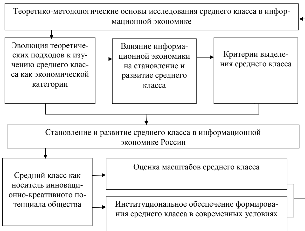
Рис.1. Блок-схема диссертационного исследования

Структура работы. Диссертация состоит из введения, двух глав, включающих шесть параграфов, заключения, библиографического списка использованной литературы, включающего 201 наименование. Работа изложена на 157 страницах, содержит 10 таблиц, 12 рисунков и 3 приложения. Логика исследования представлена на рисунке 1.