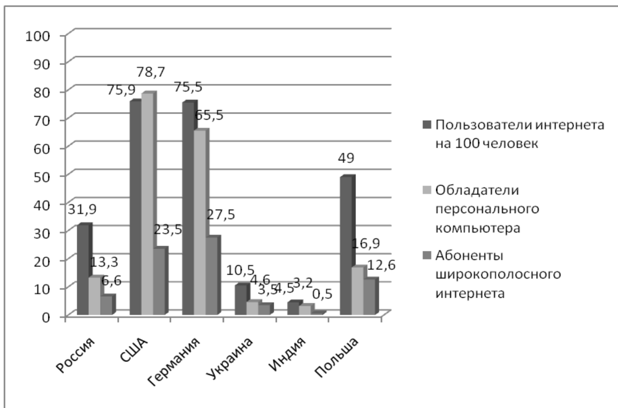
Рис. 2. Доступ к информационно-телекоммуникационным технологиям населения ряда стран 2 , в %.

бильной связи; абоненты широкополосного доступа к интернету; доступность и стоимость информационных и телекоммуникационных технологий. В Докладе представлены данные по 169 странам, поэтому мы для упрощения анализа выделили 3 группы стран: с очень высоким уровнем развития человеческого потенциала – США (4 место), Германию (10 место) и Польшу (41 место); с высоким уровнем развития человеческого потенциала – Россию (65 место) и Украину (69 место), а также со средним – Индию (119 место).