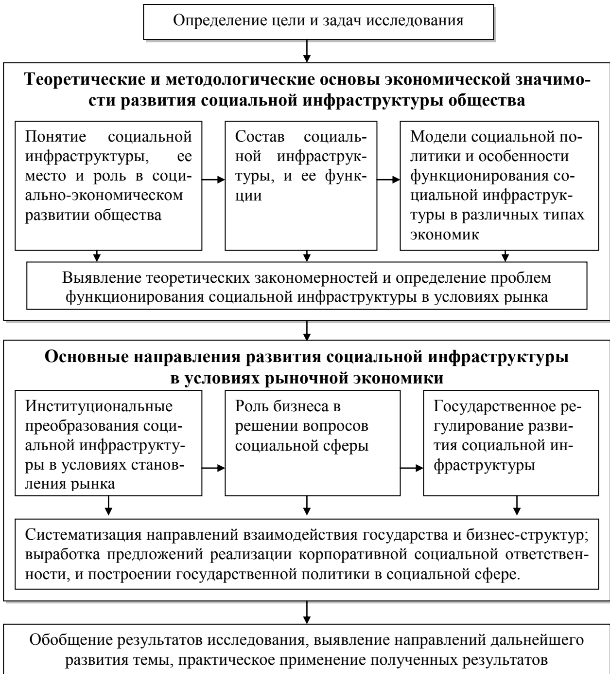
Рис. 1 Блок-схема диссертационного исследования

Социальная инфраструктура – совокупность отраслей, подотраслей экономики и видов деятельности, функциональное назначение которых выражается в производстве и реализации услуг и благ для населения. Под термином «социальная инфраструктура» следует подразумевать сферу жизнеобеспечения населения, сферу услуг. Когда мы говорим о социальной инфраструктуре как части институциональной системы общества, то имеем в виду условия жизнедеятель-