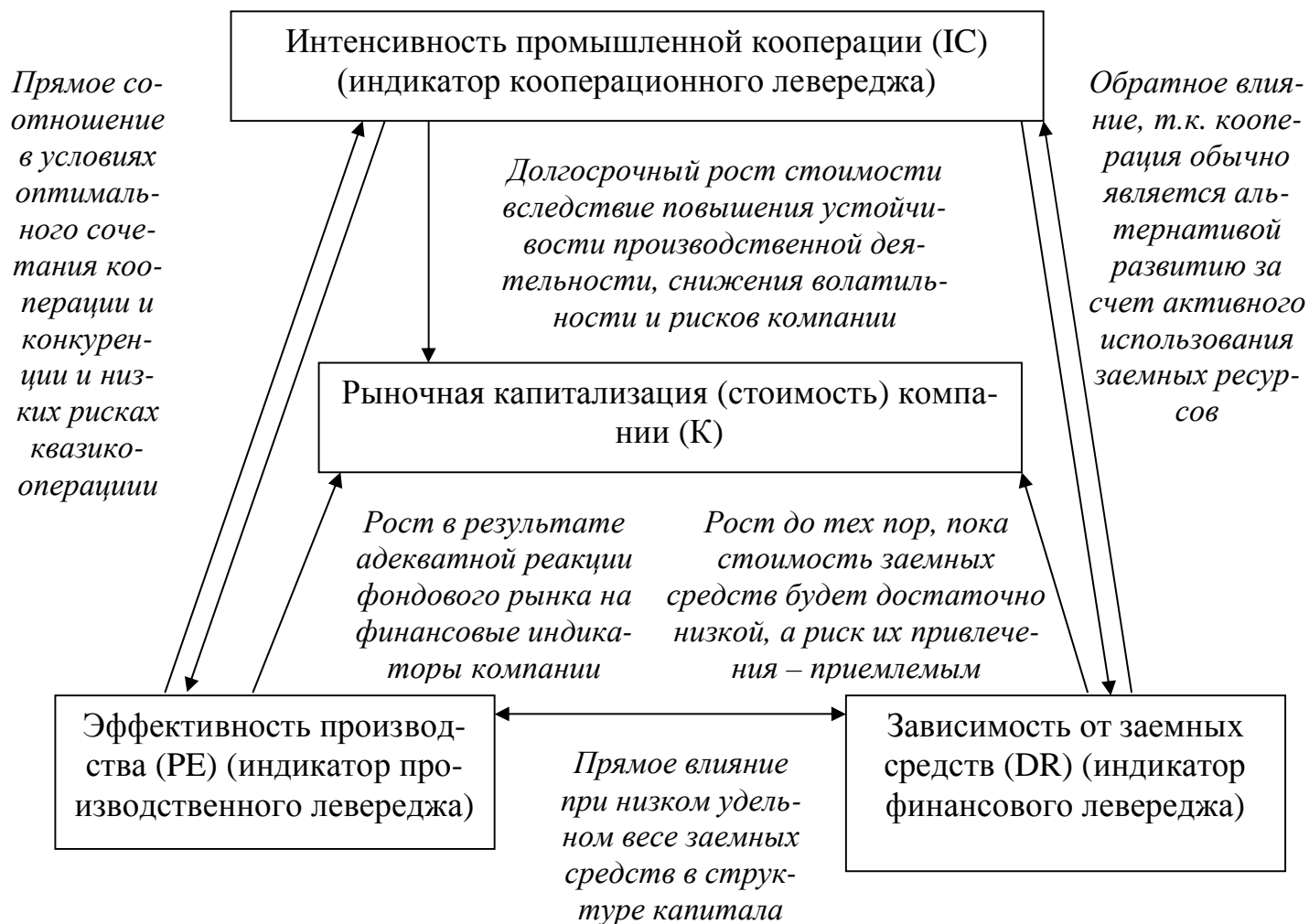
Рис. 7. Концептуальная («идеальная») модель взаимовлияния различных видов леведреджа и их влияния на стоимость компании

витого и транспарентного фондового рынка, низких рисков квазиоперации и адекватной действительности финансовой отчетности корпораций.