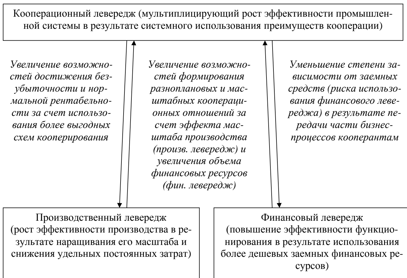
Рис. 4. Характер взаимосвязи кооперационного, производственного и финансового леведреджей предприятия

- для промышленной кооперации в сфере снабжения – эффект кооперационного леведреджа формируется за счет улучшения качества поставок полуфабрикатов и комплектующих, сокращения удельного веса брака в структуре поставок, возможности влиять на производственную политику кооперанта в направлении изготовления новых, улучшенных модификаций полуфабрикатов и комплектующих и т.п.;