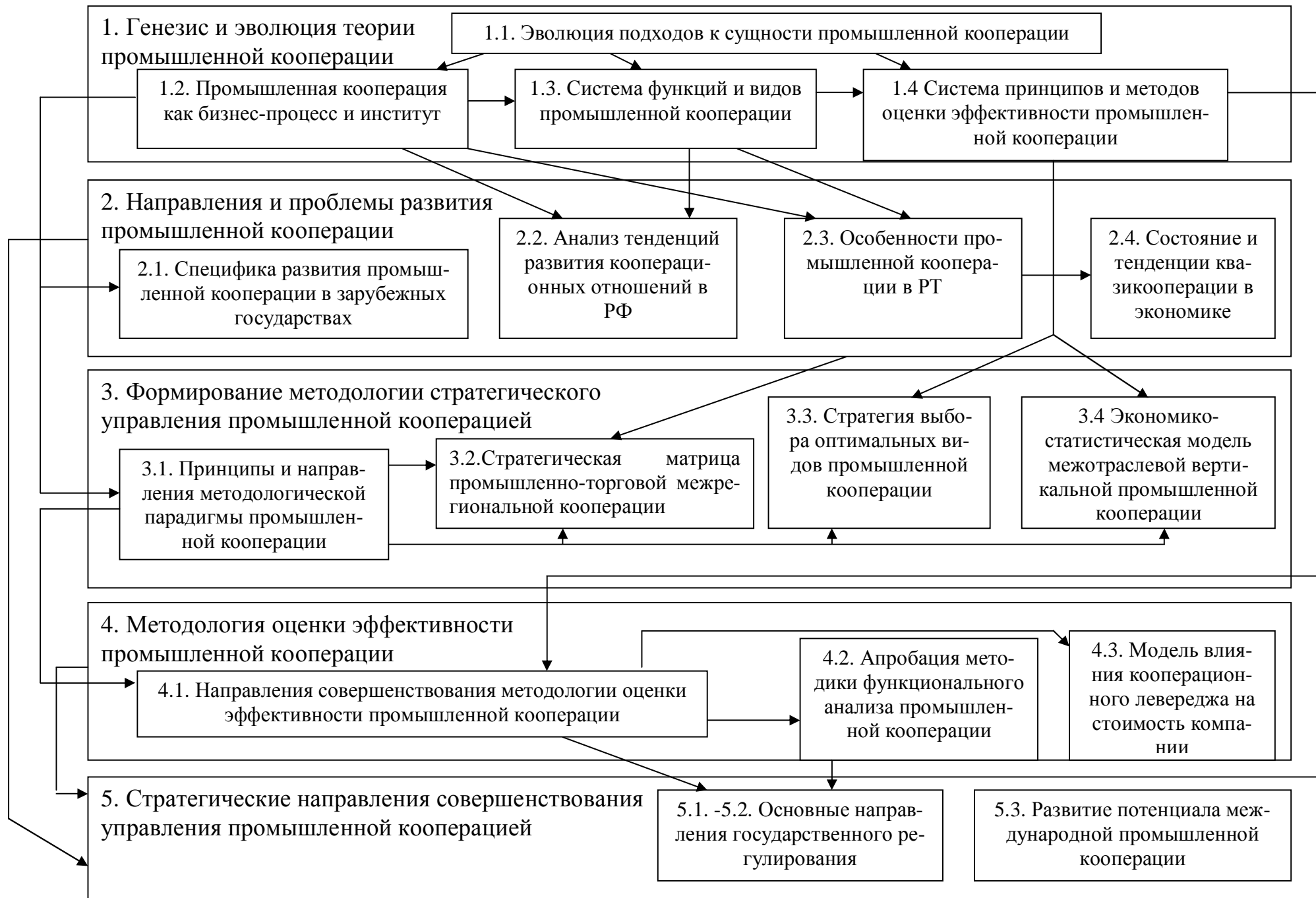
Рис. 1. Структура работы