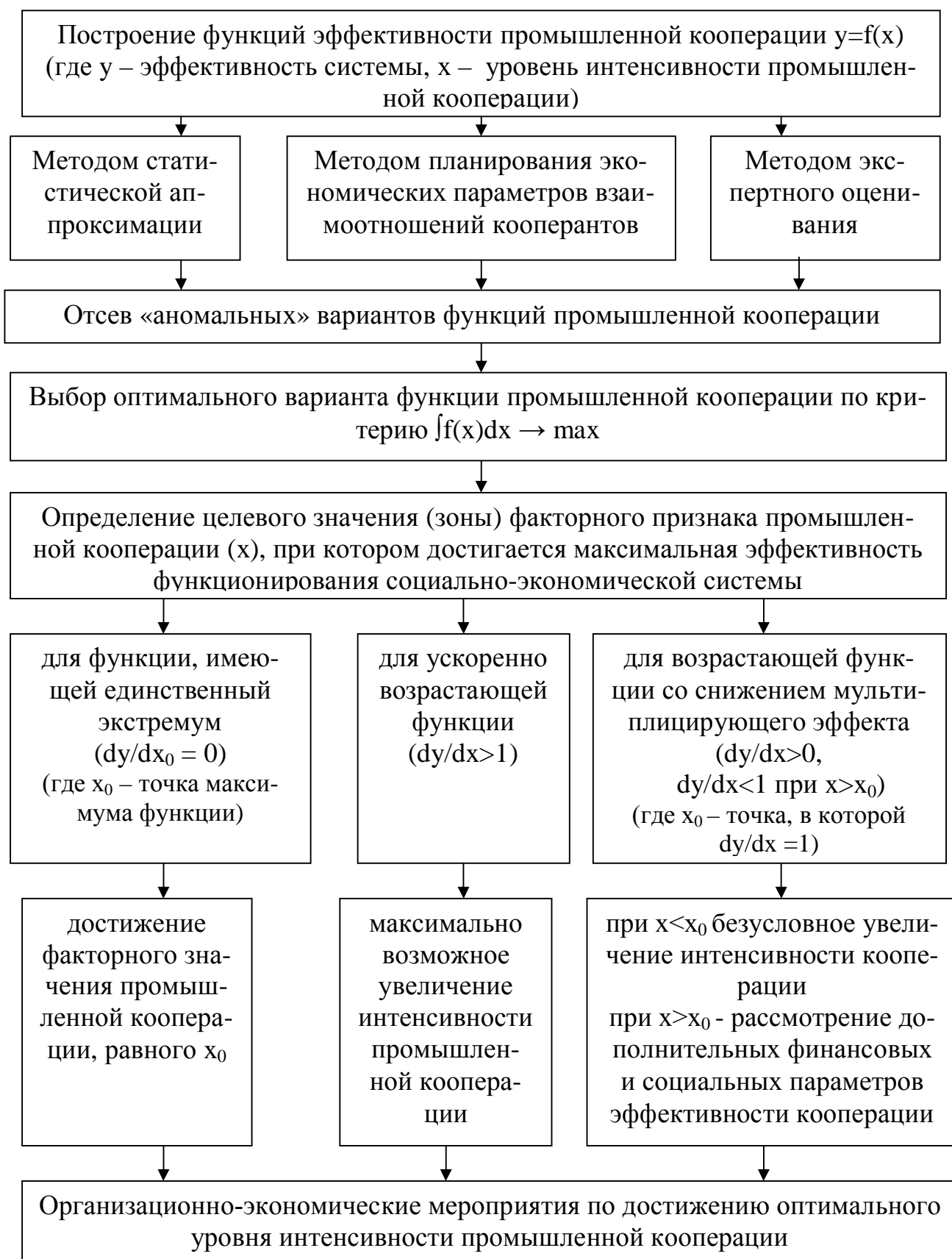
Рис.5. Последовательность применения методики функционального анализа промышленной кооперации