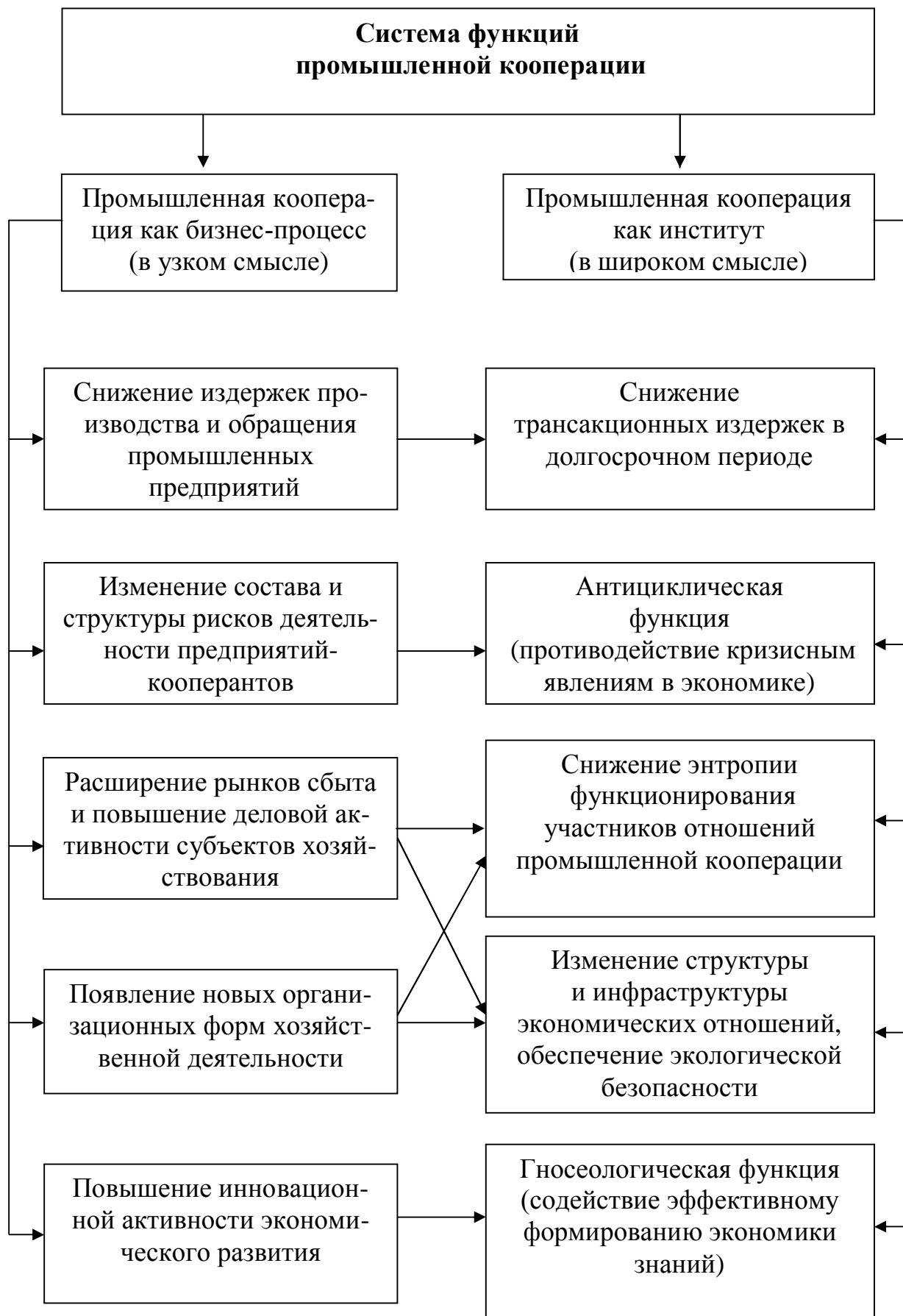
Рис. 2. Система функций промышленной кооперации