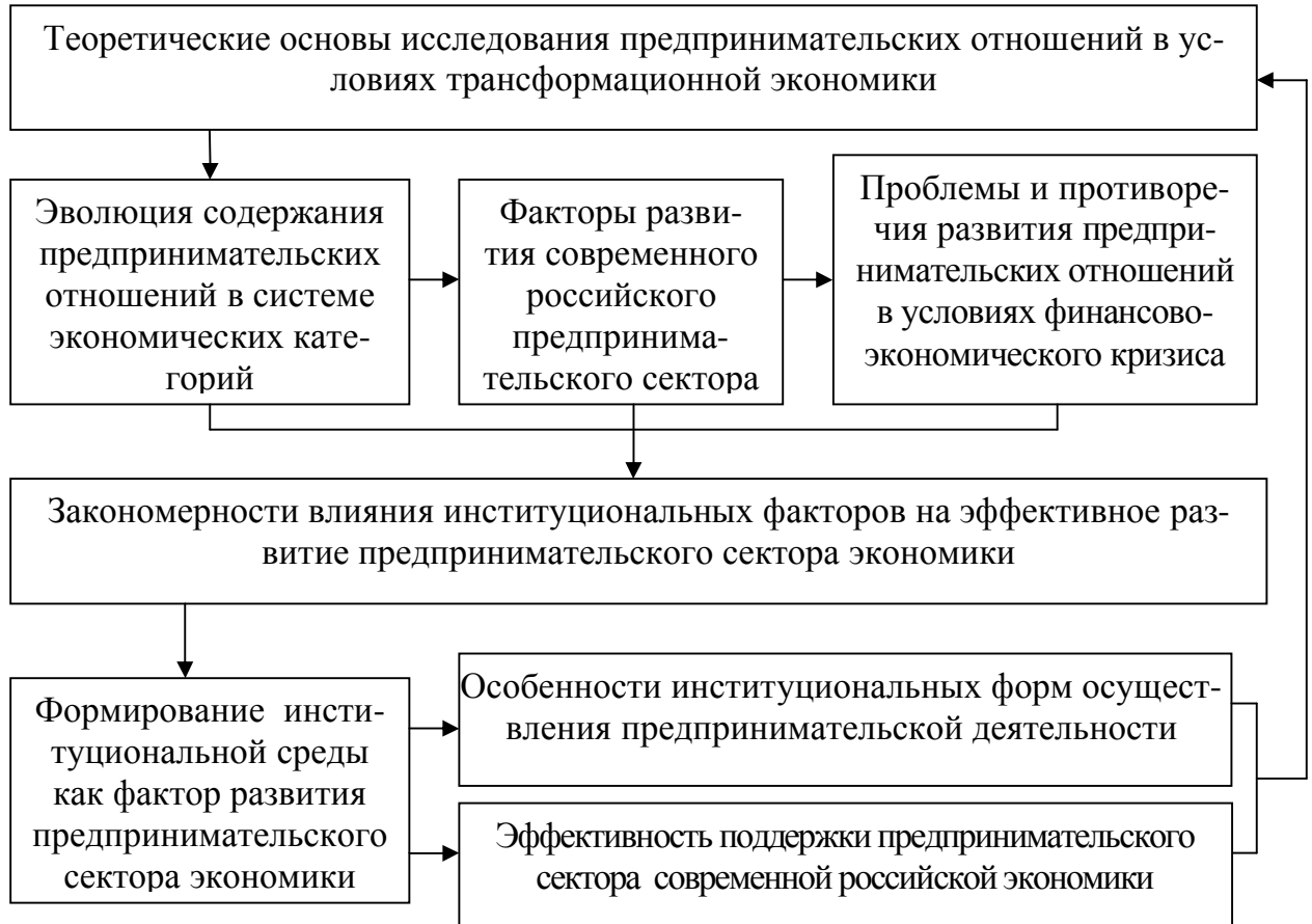
Рис. 1. Блок-схема диссертационного исследования

Логика исследования представлена на рисунке 1.