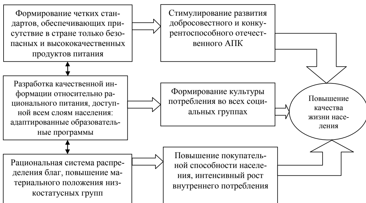
Рис. 2 Пути повышения качества питания населения

Исходя из вышеизложенного, автор предлагает следующие пути повышения качества питания населения (См.: рис. 2):