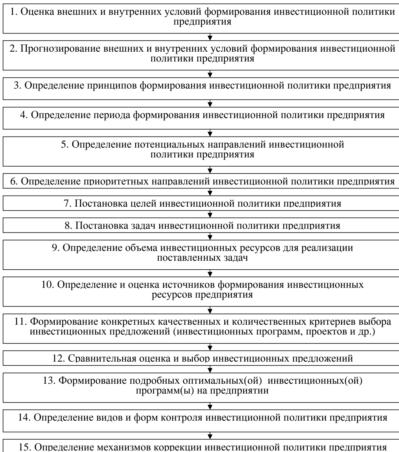
Рис. 3. Этапы формирования инвестиционной политики предприятия

Подобное выделение различных вариантов развития ситуации предлагается осуществлять при определении потенциальных и приоритетных направлений инвестиционной политики предприятия.