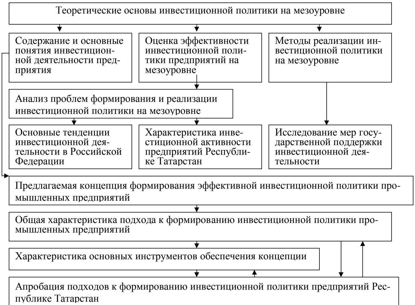
Рис. 1 Блок-схема диссертационного исследования