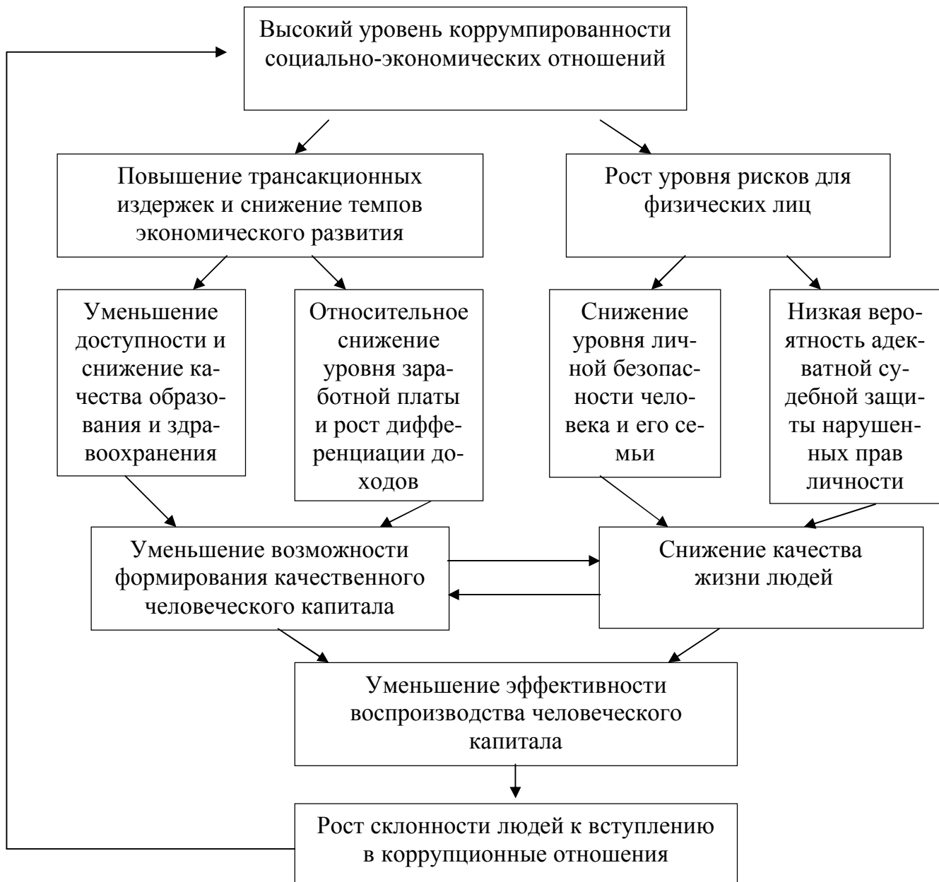
Рис.3. Взаимное влияние коррупции и эффективности воспроизводства человеческого капитала.

В наиболее общем виде влияние коррупции оказывает на процесс воспроизводства человеческого капитала показано на рисунке 3.