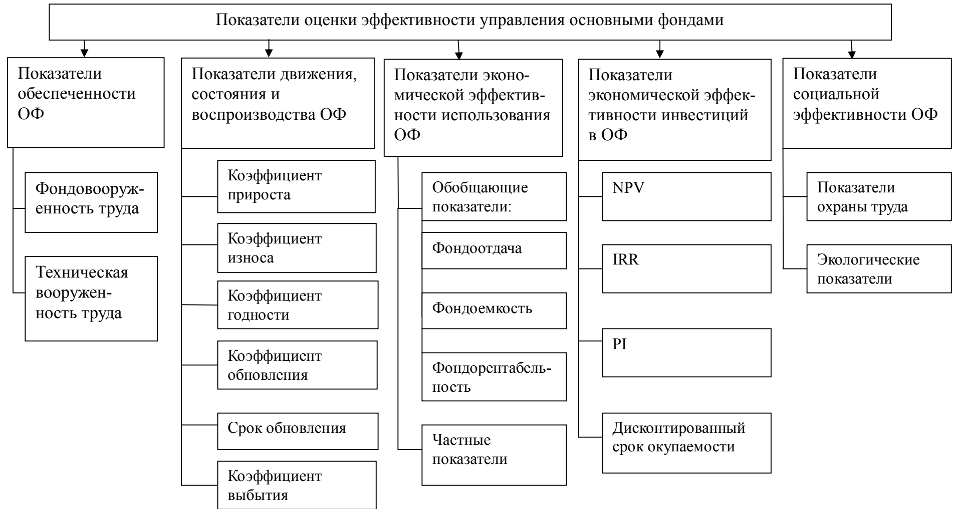
Рис. 3. Классификация показателей оценки эффективности управления основными фондами