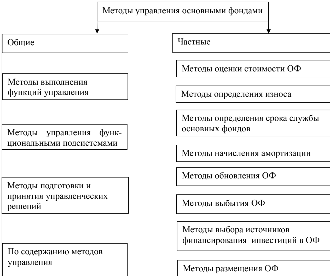
Рис. 2. Классификация методов управления основными фондами

Предлагаем разделить методы управления основными фондами на две группы: общие и частные. Общие методы содержат способы, приемы решения задач субъектом в процессе управленческой деятельности. Частные методы управления связаны со спецификой основных фондов, как объекта управления. Классификация методов управления основными фондами приведена на рисунке 2.