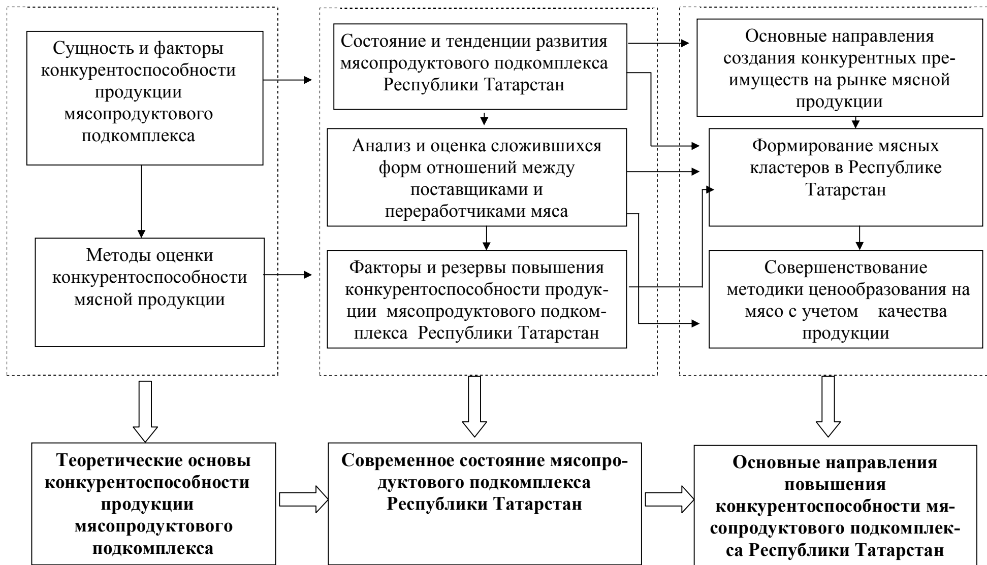
Рис.1 Логика диссертационного исследования