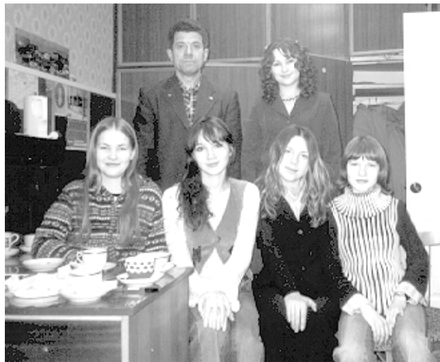
На снимке: одно из предновогодних заседаний «Радуги»

«Радуга» радужно встре- тит вас, даже напоит горячим чаем, наполнит вас надеждой, выслушает и поймет. Желаем всем в Новом году творческих успехов. Пусть вам сопутствует большая удача, вечная на- дежда, любовь близких и верная дружба! Поздравляем! Пригла- шаем! Ждем!