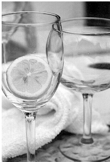
«ОСТАТКИ - КИСЛЫ» - так назвал свою оче- редную творческую фотоработу Булат Гилемханов.