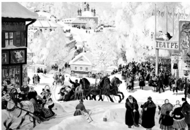
Б. Кустодиев. Масленица. 1919 г.

Материал подготовлен с помощью журнала «Юность» № 3 2009 года.