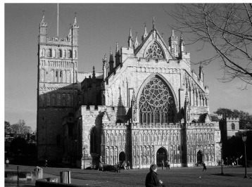
University of Exeter