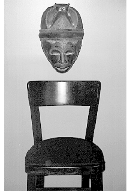
Не на своем месте

И "Мысли вслух" – так можно назвать поэтические строки Булата ГИЛЕМХАНОВА: