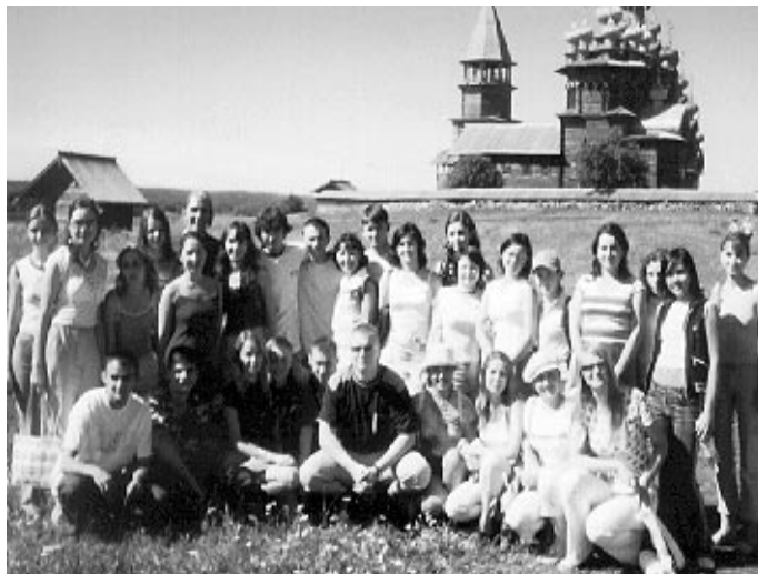
(Начало. Окончание на стр. 4)

– Нас соединила вместе и связала единой невидимой ниточкой Карелия. Мы, гости из другой республики, жи-