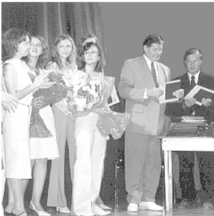
Выпуск специалистов состоялся!