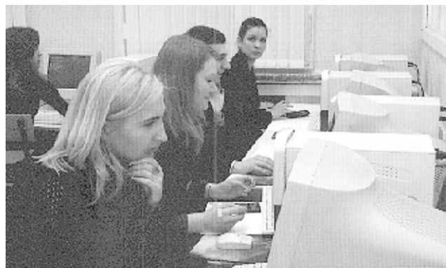
Долгие часы будущие бакалавры проводили в компьютерных аудиториях...